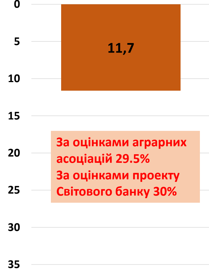
Потенційні обсяги тіньового обробітку землі

Млн. га ■ Фіз.особами та юр.особами на заг. сист. оподатк. ■ Юр.особами - платниками єдиного с/г податку